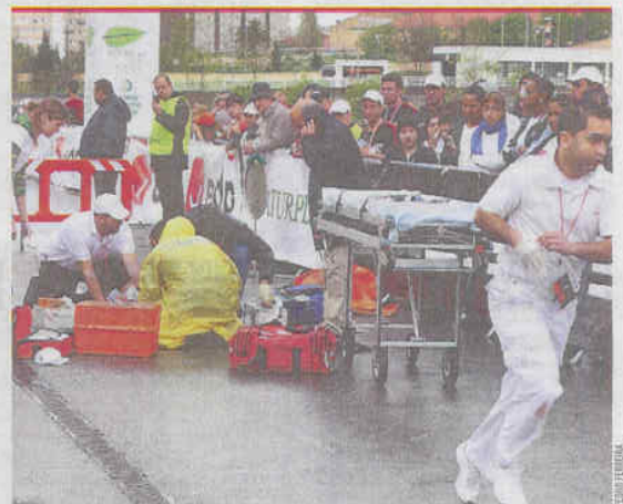
APREENSÃO. As pessoas que se deslocaram às imediações do Estádio da Luz para ver a corrida dos encarnados não escondem a preocupação pelo estado de saúde de um dos participantes, que se sentiu mal mas foi prontamente socorrido